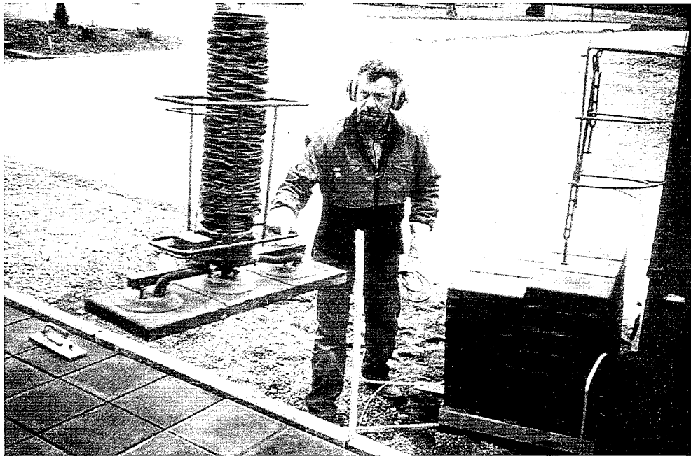
Kan också användas för att plocka upp befintliga gångbanelplattor