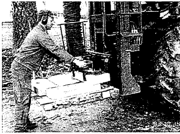
Sättning av nedgrävd betongkantsten. Maskinen rör sig sakta framåt